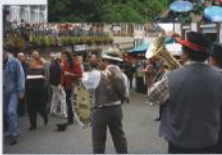
Weinfest im September

Konzertbesuche Wohnmobilstellplatz Sporteinrichtungen Gruppenprogramme Heiraten im Schloss Feiern im Kurpfalzsaal Weinstuben, Cafés, Restaurants Wein- und Biergärten Waldgaststätten, Wanderhütten Einkaufsmöglichkeiten Bahnstation Linienbus